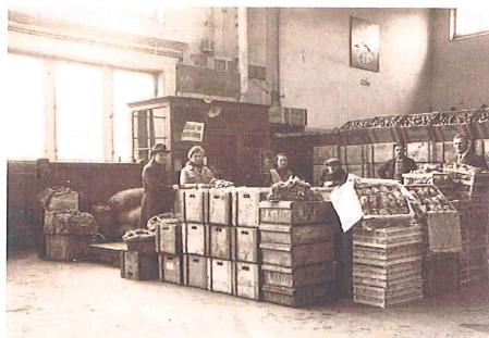
Das Unternehmen „Hans Kuffer“ beliefert seit 1910 Einzelhändler, Lebensmittelgeschäfte und gastronomische Betriebe im Großraum München.